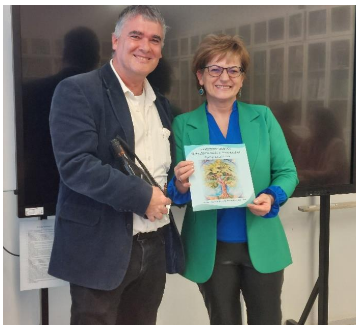
A Gönczy Tehetségpont saját természettudományos jó gyakorlatainak tanári kézikönyvével